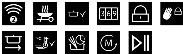
4149_NorCook IH N8106 BK