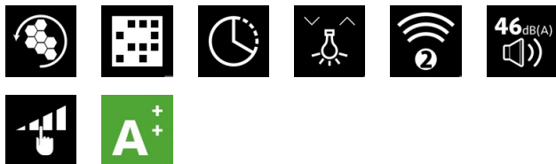
8536_NorBreeze SLIM 90 BK